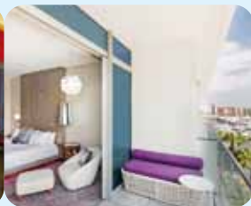
W Singapore - Sentosa Cove